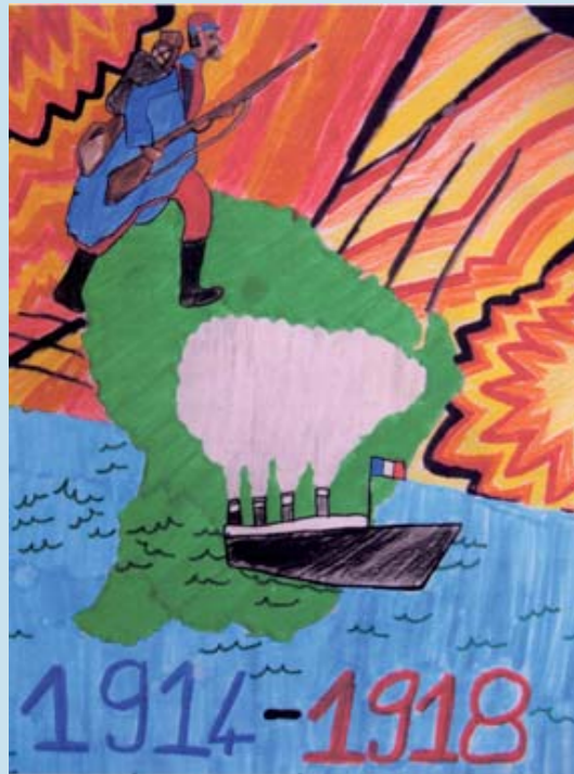
Prix de la première participation : Ecole Edmard Malacarnet de Cayenne (973)