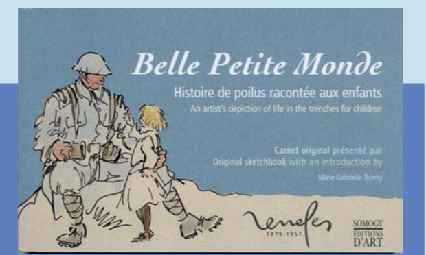
Carnet de l'artiste Renefer pour sa fille surnommée « Belle Petite Monde », source d'inspiration de ce concours.